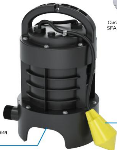
НАДЕЖНОСТЬ Дробильные лезвия ProX K2

ВНИМАНИЕ! Так как в насосе SANIPUMP ножи находятся в доступном месте, устанавливая насос в резервуар, яму или колодец, убедитесь, что они закрыты люком или крышкой, которые надежно защищены от постороннего или случайного доступа.