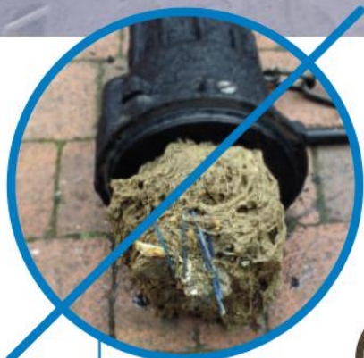
Заблокированный насос без системы измельчения

Засоренные трубы и незасоренные, благодаря использованию системы измельчения