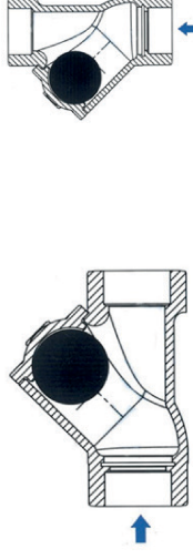
Рис.2 Пространственные положения установки обратного шарового клапана.