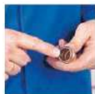
Проверить, находится ли уплотняющий элемент в соответствующем положении.