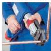
После того как Вы удостоверились, что труба не сдвинулась, начните опрессовку. После окончания полного цикла зажима раздвиньте обжимные губки и снимите их с фитинга.