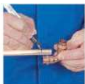
Отметить, на какую глубину труба должна войти в фитинг.