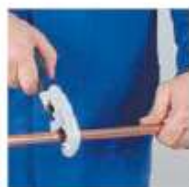
Обрезать трубу под прямым углом с помощью трубореза.

Смонтированная система подлежит гидравлическому испытанию в соответствии с требованиями СП 73.13330.2016 .