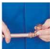
Оборотным движением надвинуть фитинг на трубу до упора.