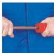
Очистить внутренние и наружные края трубы прибором для калибровки.