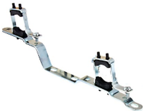
КРОНШТЕЙН КОЛЛЕКТОРНЫЙ СДВОЕННЫЙ

Произведено по технологии: VALTEC s.r.l., Via Pietro Cossa, 2, 25135-Brescia, ITALY Изготовитель: IVAR S.p.A., Via IV Novembre, 181, 25080, Prevalle (BS), ITALY